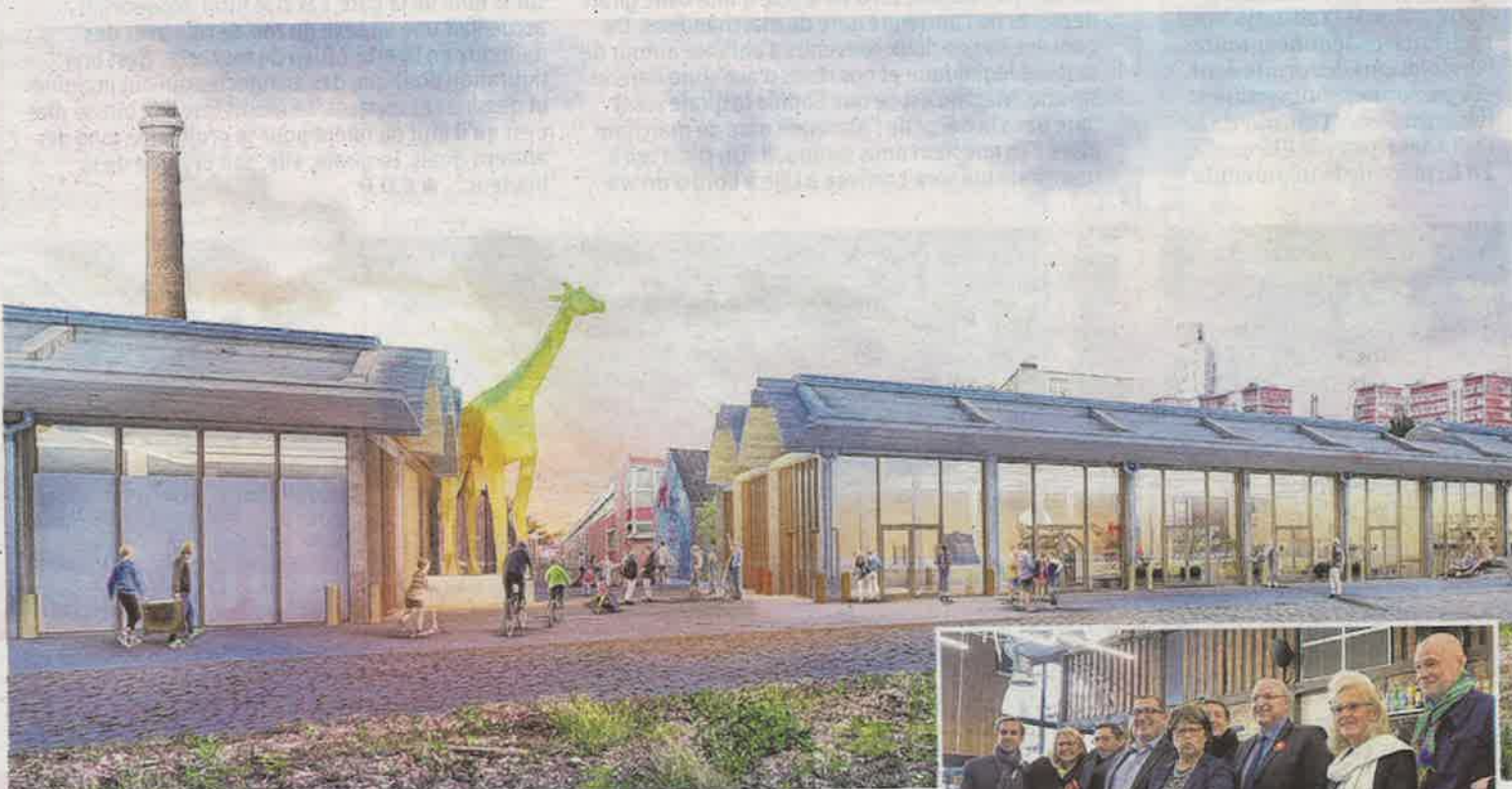
Une vue de l'extérieur avec la percée qui sera réalisée au cœur de cette halle pour créer une place reliée au quartier. La girafe n'est là que pour donner des proportions.

Le groupe SMart et InitiativesET-cité ont été retenus parmi une trentaine de candidats en 2016 suite à l'appel à Manifestation d'intérêt de la ville. SMart est une coopérative européenne qui accompagne des porteurs de projets dans une seule et même entreprise. InitiativesET-cité est le premier cluster de l'économie so-